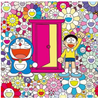
村上隆 「どこでもドア」お花畑にやって来た！