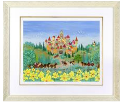
ラファイ 「おとぎの国の園遊会へ」