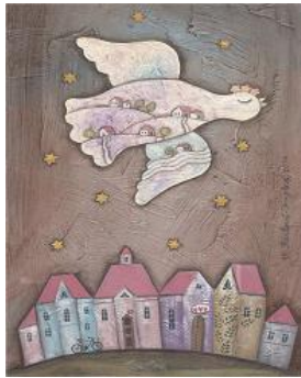
ティムブロヴァ 「鳥が見た夢」