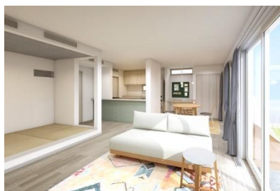
リビング完成予想図