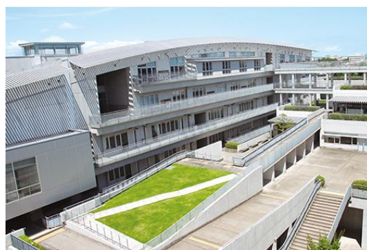
公立大学法人 静岡文化芸術大学 SUAC