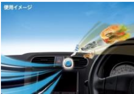
『ファブリーズ クルマ イージークリップ』使用イメージ

「ファブリーズ クルマ イージークリップ」は、P&Gのエアケアブランド「ファブリーズ」の車専用消臭芳香剤です。エアコンの送風口にセットすることで、車内のニオイの原因となる食べ物や、汗などの体臭、ペットやエアコン、タバコのニオイなどをしっかり消臭し、車内の快適空間を実現します。ワンタッチで簡単にセットでき、約30日間香りが継続するので、手軽に使えるのも特長のひとつです。好みに合わせて選べる香りの種類は10種類以上、香りの強さ調節ダイヤルつき。自宅の車でのドライブ時のニオイ対策にもおすすめです。