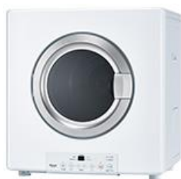
ガス衣類乾燥機 （リンナイ 乾太くん）