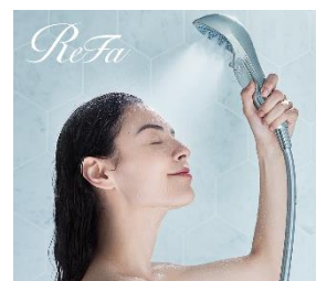
ファインバブルシャワー （ReFa ファインバブル S）