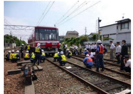
遠州鉄道(株)での 過去脱線復旧訓練の様子

その他 ・当日の各社の運行状況、天候の急変等により、急遽訓練が中止となる場合がございます。