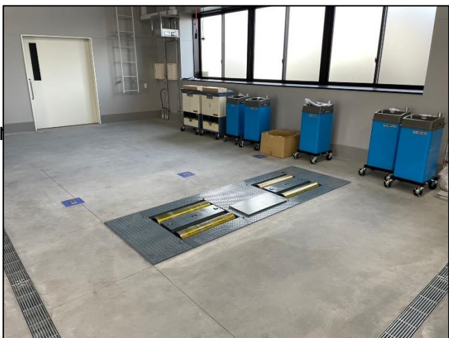
タクシー専用ストール