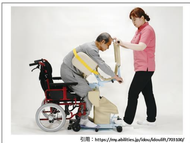
移乗機器（ささえて）