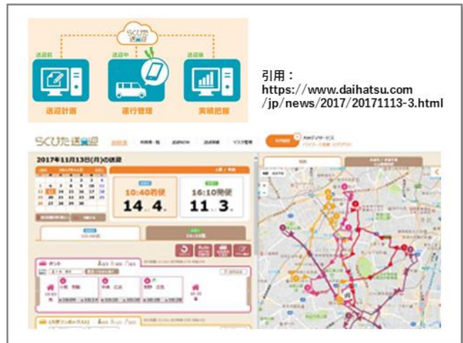
送迎支援システム（らくびた送迎）