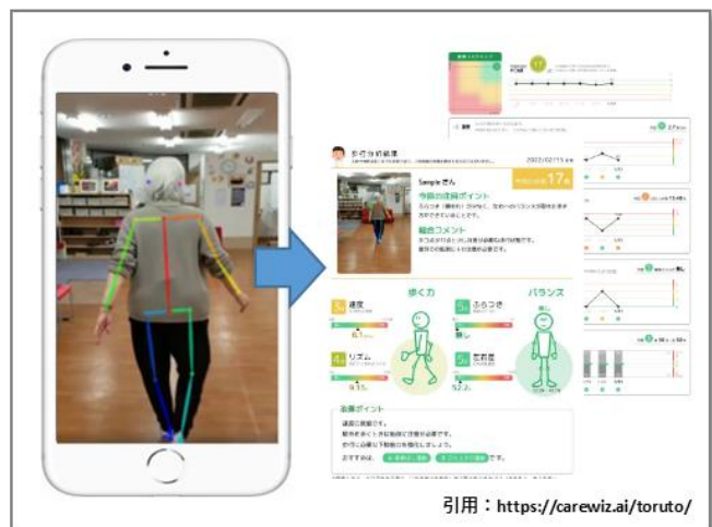
歩行解析アプリ（トルト）