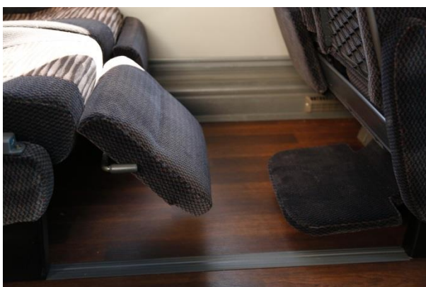
※レッグレスト(左)、フットレスト(右)