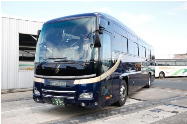
※特別車体カラーリング(メタリックブルー)