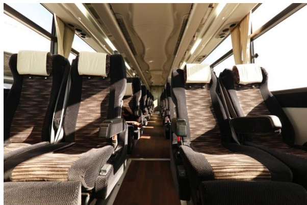
※ワイドシート・ヘッドレスト