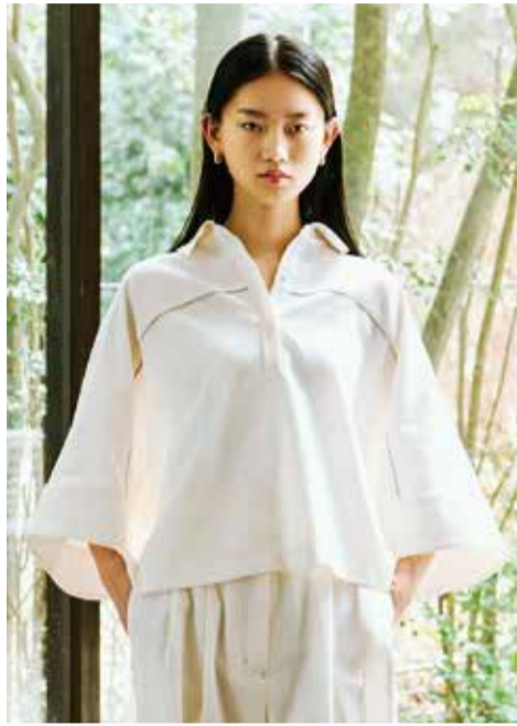
〈キャストコロソ〉スキッパーブラウス...29,700円 ■本館2階 婦人服