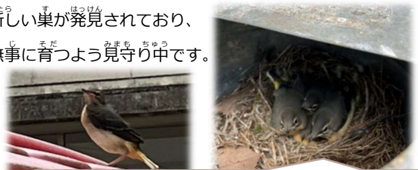
じょうろうの中に巣があったので、発見した職員はびっくり!

とつぜんあらわれ どり す たまご 突然現れた鳥の巣と卵にドキドキハラハラ、その動向を見守っていましたが、すべての卵が無事に孵り、立派に成長して七生の空へと旅立っていきました。直近でも新しい巣が発見されており、無事に育つよう見守り中です。