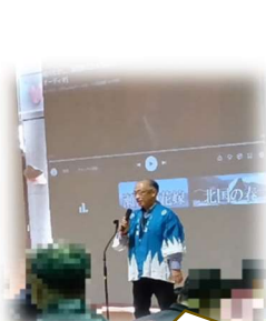
園長による開会宣言

会の最後には新任・転入職員からのごあいさつもあり、春の訪れと出会いの喜びを感じる1日となりました。