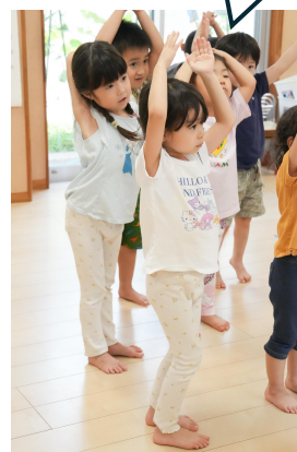
立派なきゅうりができた