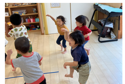
ご先祖様と馬に乗って色々なところへおでかけしたよ