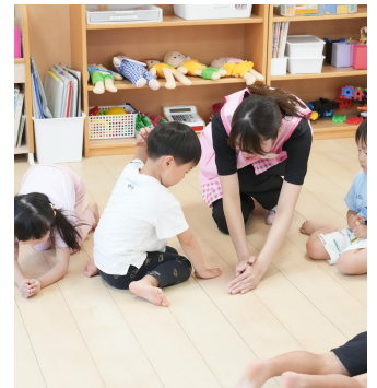
ふかふかになった土に種を植えたよ