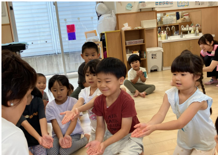
さーやんから種をもらって大事に持っている子ども達