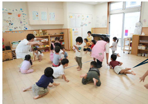
最初は土を掘っていた子ども達だが、友だちがドリルになっているのを見て真似している