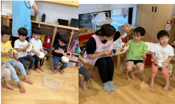
活動の様子が分かる写真（2枚以上を貼付してください）