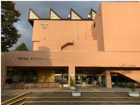
■ 神戸市立王子スポーツセンター