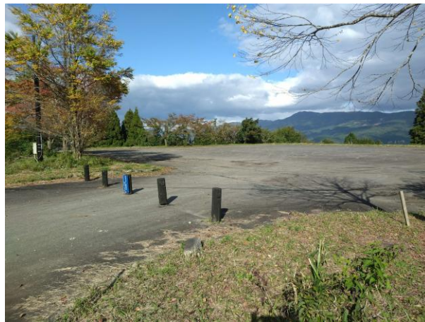
■ 兔和野高原駐車場