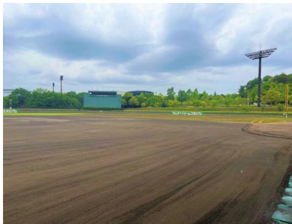
■ サムティドリームスタジアム (三木総合防災公園野球場)