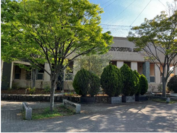
■ あじさいスタジアム北神戸