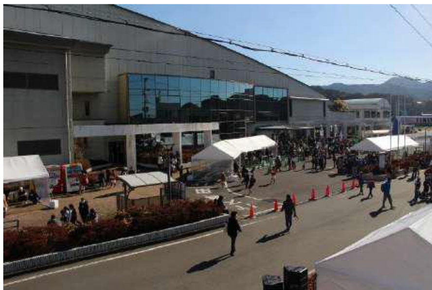
■ 上富田文化会館周辺