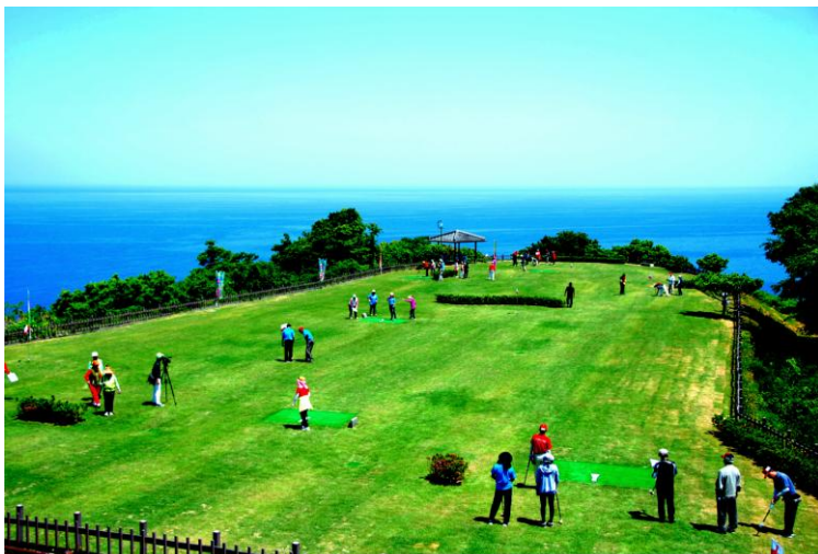
■ グラウンドゴルフのふる里公園 「潮風の丘とまり」