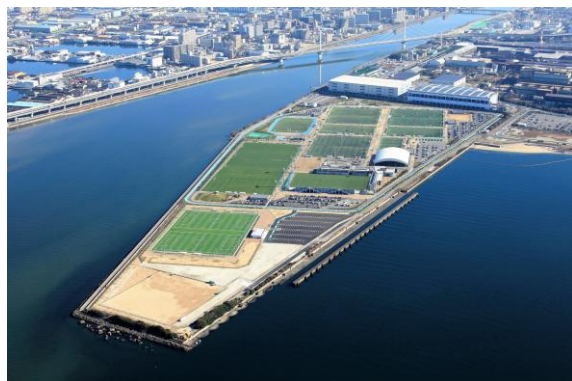
■ J-GREEN堺 (堺市立サッカー・ナショナルトレーニングセンター)