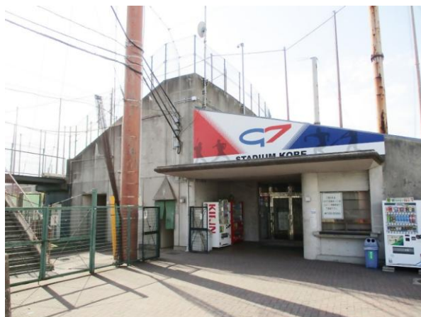
■ G7 スタジアム神戸