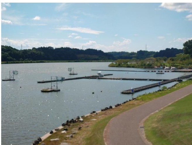
■ あわら市北潟湖カヌーポロ競技場（北潟湖畔公園・サイクリングパーク）