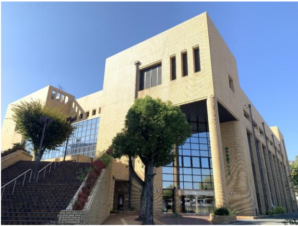
■ 兵庫県立文化体育館