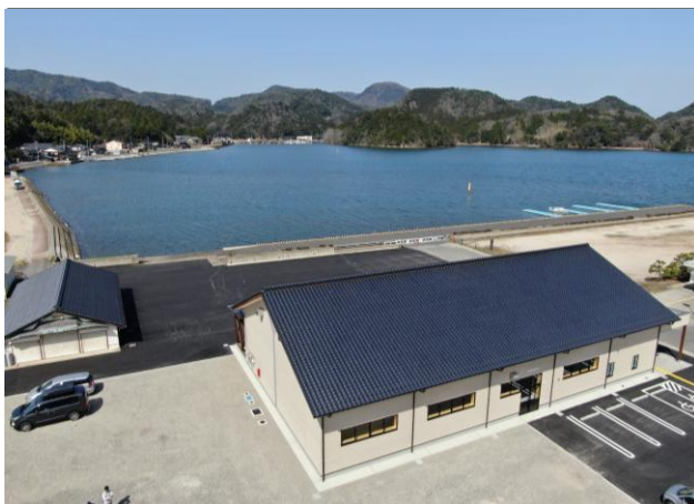
■ 会場名（京丹後市久美浜湾力又一競技場）