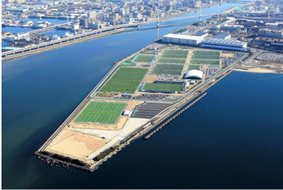
■ J-GREEN堺 (堺市立サッカー・ナショナルトレーニングセンター)