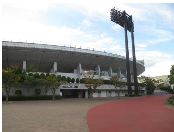
■ ほっともっとフィールド神戸