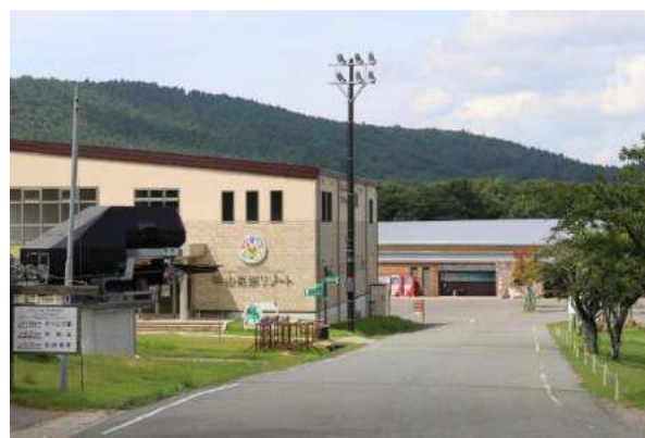
■ 峰山高原会場施設