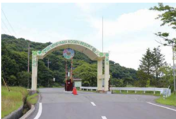
■ 峰山高原会場 入口ゲート