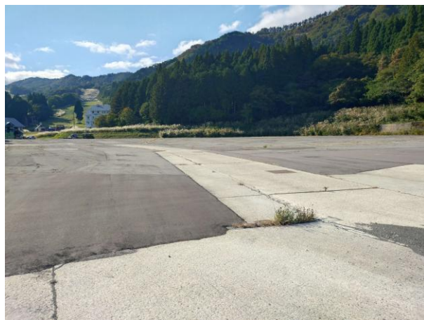
■ 八千北高原駐車場