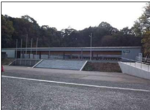
■ 和歌山県ライフル射撃場