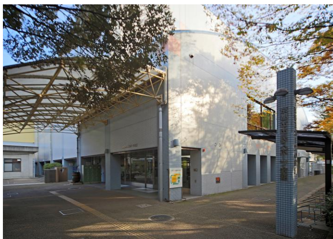
■ 京都市市民スポーツ会館