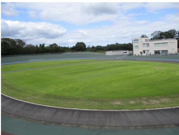
■ 倉吉自転車競技場