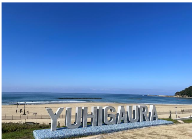
■ 会場名 夕日ヶ浦海岸