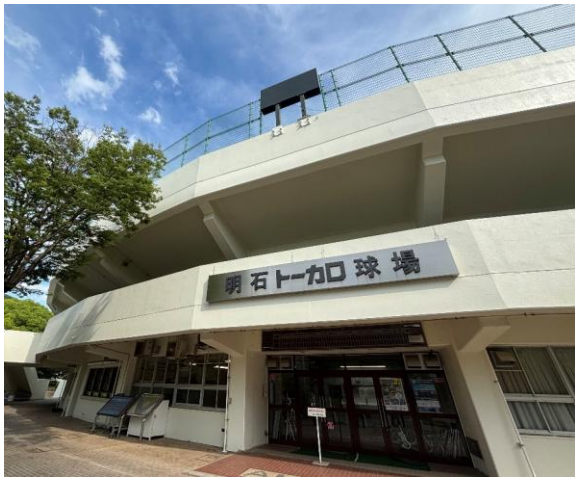
■ 明石トーカロ球場（明石公園第1野球場）