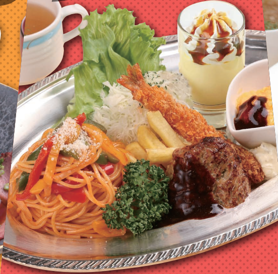
6 大人のお子様ランチ (スープ付) ¥1,550 (税込)