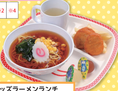
13 キッズラーメンランチ リンゴジュース付 ¥680 (税込)