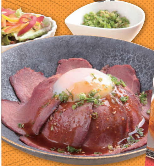
5 THE! ローストビーフ丼 (サラダ・味噌汁付) ¥1,480 (税込)