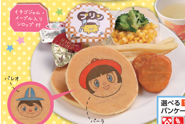
選べる 11 パレオ ・ 12 パーラ の パンケーキランチ リンゴジュース付 ¥850 (税込)