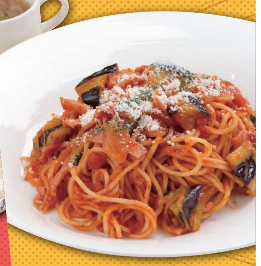
7 シェフ特製トマトパスタ (スープ付) ¥1,180 (税込)