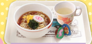
14 ベビーラーメン リンゴジュース付 ¥520 (税込)