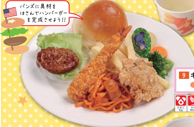
9 キッズハンバーガーランチ リンゴジュース付 ¥820 (税込)