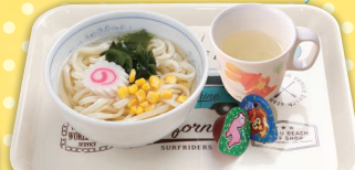
15 ベビーうどん リンゴジュース付 ¥520 (税込)