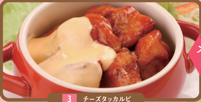
3 チーズタッカルビ