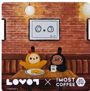
オリジナルコースター