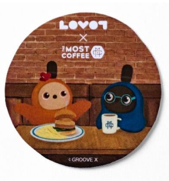
オリジナルステッカー