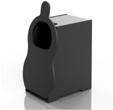
LOVOT 服回収ボックス（※画像はイメージです）

※HUG とは、『LOVOT』公式ウェブストアで利用可能なクーポンへ交換できる、独自のポイントプログラムです。