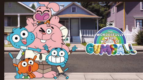
© 2026 Warner Bros. Discovery, Inc. or its subsidiaries and affiliates. All rights reserved.

学校とスーパーヒロインの両立は大変かもしれないけれど、3人が力を合わせればへっちゃら！ガールズパワー炸裂で、悪者たちに戦いを挑みます。