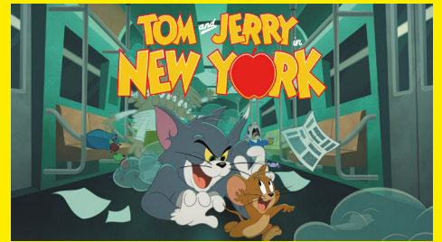
© 2021 Warner Bros. Entertainment Inc. TOM AND JERRY and all related characters and elements are trademarks of and © Turner Entertainment Co.