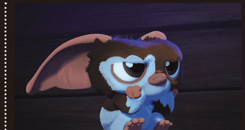
© 2026 Warner Bros. Discovery, Inc. or its subsidiaries and affiliates. All rights reserved.

「おかしなガムボール」がタイトルを新たに「やっぱりおかしなガムボール」となって帰ってきた！