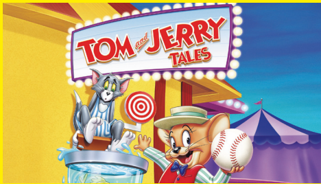
© Turner Entertainment Co. TOM AND JERRY and all related characters and elements are trademarks of and © Turner Entertainment Co.