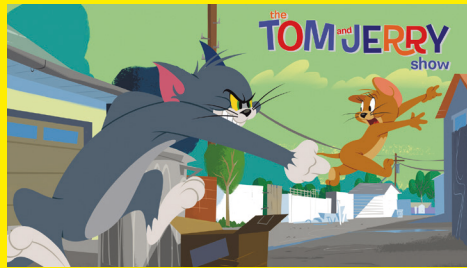
© Warner Bros. Entertainment Inc. TOM AND JERRY and all related characters and elements are trademarks of and © Turner Entertainment Co.