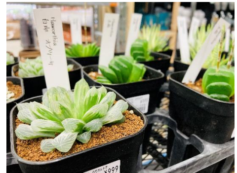
種類豊富な多肉植物