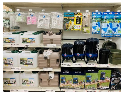
災害時にも役立つ「アウトドア用品」