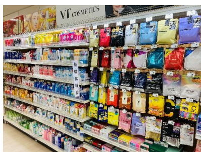
「ビューティ・コスメ関連」を強化

また、「しっかり品質を納得価格」で提供する当社プライベートブランド「iEMORE（イエモア）」の商品とあわせ、日常生活から災害対策まで備えをサポートする売場でお客さまをお迎えします。