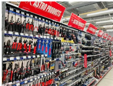
「アストロプロダクツ」の自動車整備用品