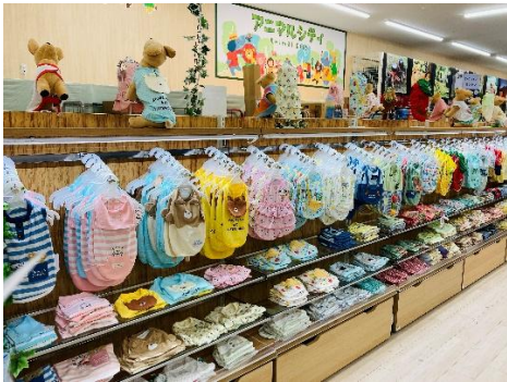
豊富に取り揃えた「ペット用品」

また、ガーデニング関連商品では、オリーブや多肉植物などの定番から、ユーカリなどのオーグープランツ類、アロイド系（サトイモ科）の観葉植物など、個性的でインテリア性の高い樹木や観葉植物を厳選。植栽用の鉢や装飾品などの園芸用品を含めた約 3,200 アイテムの品揃えで「自分好みにコーディネートできる楽しみ」を提供します。