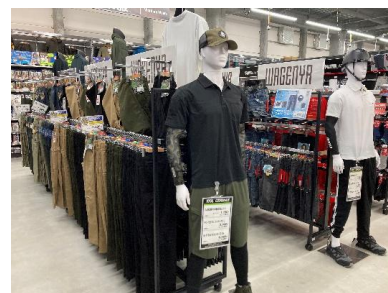
プライベートブランドの「和玄屋」