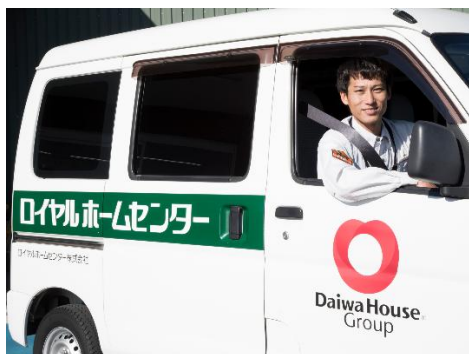
当社従業員が行う取り付け・交換代行サービス「ロイサポート」

※6. 各種専門の資格を有する当社従業員が見積もりから施工まで行うサービスです。