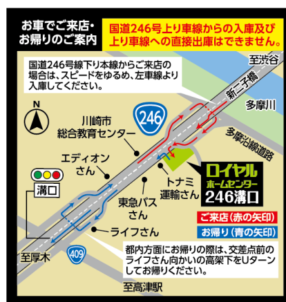
「ロイヤルホームセンター246溝口」(案内図)