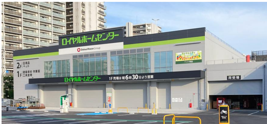
【ロイヤルホームセンター246溝口】

当店のオープンにより当社ホームセンターは全国で67店舗目、神奈川県内で14店舗目となります。