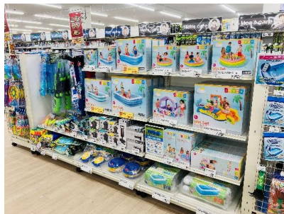
季節を楽しめる「レジャー用品」