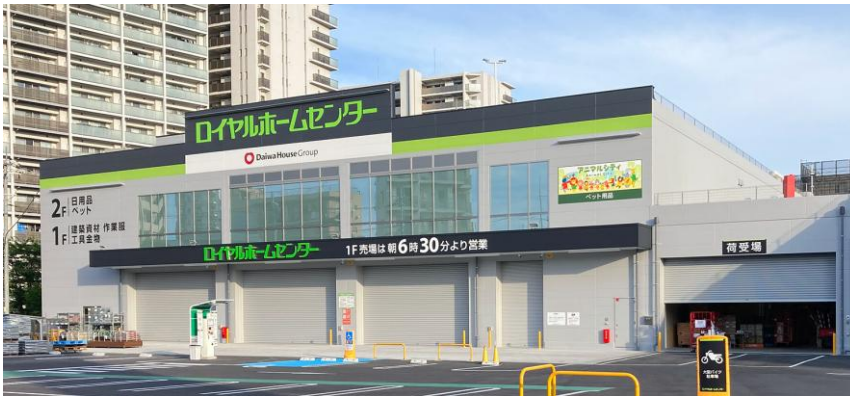
【ロイヤルホームセンター246溝口】

当店のオープンにより当社ホームセンターは全国で67店舗目、神奈川県内で14店舗目となります。