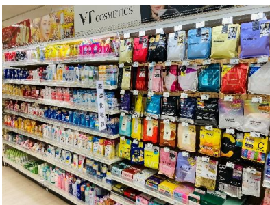
「ビューティ・コスメ関連」を強化

また、「しっかり品質を納得価格」で提供する当社プライベートブランド「iEMOE（イエモア）」の商品とあわせ、日常生活から災害対策まで備えをサポートする売場でお客さまをお迎えします。