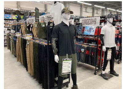
プライベートブランドの「和玄屋」