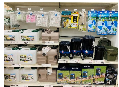
災害時にも役立つ「アウトドア用品」