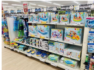
季節を楽しめる「レジャー用品」