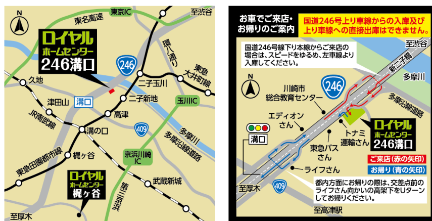
「ロイヤルプロ246溝口」(案内図)