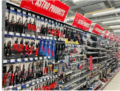
「アストロプロダクツ」の自動車整備用品