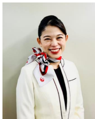
▲JALふるさとアンバサダー

※JAL客室乗務員がゆかりのある地域に移住し、培ってきた知見を活かして地域資源を活用したコンテンツの創出や商品開発など、地域課題に対する企画提案などを行います。