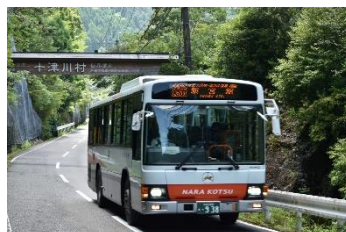
▲奈良交通バスを貸切で運行