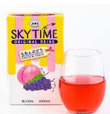
▲JAL機内限定飲料「スカイタイム」を提供