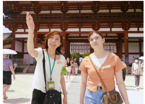
▲通訳案内士の案内イメージ

より一層奈良の魅力を感じていただける内容となっておりますので、ぜひご乗車ください。