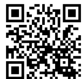
▲ウェブサイト QRコード