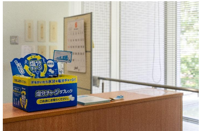
<美竹の丘・しばや：受付>