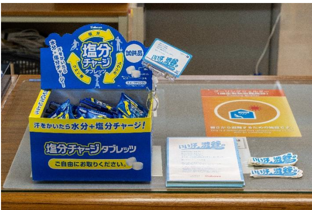
<渋谷区立商工会館：受付>