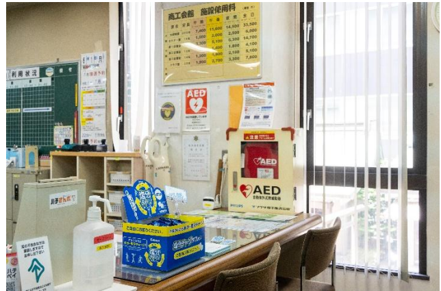
<渋谷区立商工会館：受付>