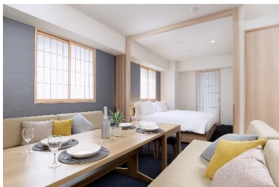
『MIMARU 東京 赤坂』一般客室

「APARTMENT HOTEL MIMARU」( https://mimaruhotels.com/ )は、キッチンやリビング・ダイニングスペースを備え、ファミリーやグループでの中長期滞在ニーズに対応する都市型アパートメントホテルです。“暮らすように滞在する”をコンセプトに、約40㎡から80㎡の客室には食器や調理器具などを常備し、ランドリールームも備えることで、旅先でも暮らしの延長線上にある自由な過ごし方を提案しています。