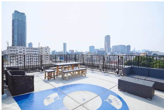
『MIMARU 東京 赤坂』屋上 ※植栽設置前

屋上もナチュラルな植栽(生の植物)に囲まれ一息ついて今の自分を感じられるような空間に