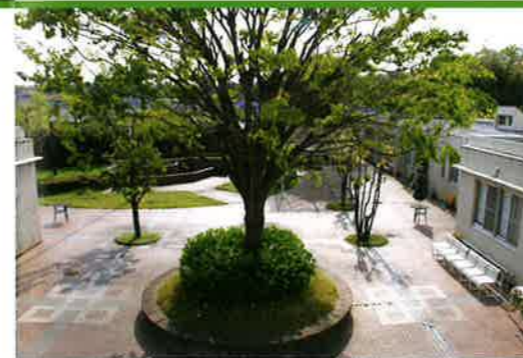
憩いの場の中庭(出会いの広場)