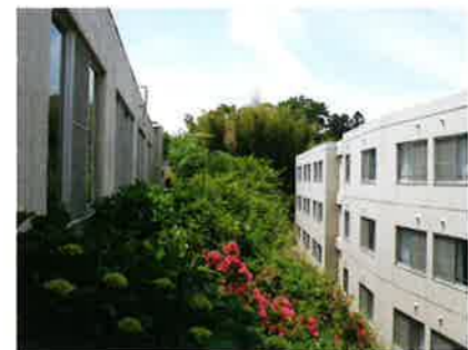
渡り廊下から望む施設の外観