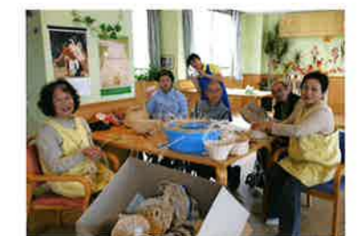
ボランティアさんと藤工芸