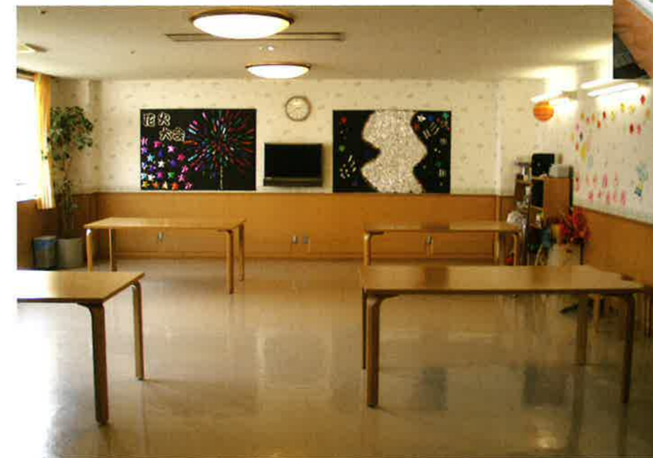
新館1F ひまわりリビング