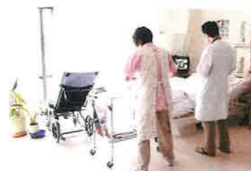
「お変わりはありませんか？」という先生の優しい言葉が印象的です