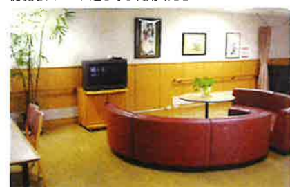
1階中央には多目的スペースがあります。お寛ぎスペースとしてご利用ください

短期入所 在宅で介護されているご家族等の休息を目的とした施設です。 ご家族などが、旅行や病気などで介護を行えないとき一時的に施設をご利用いただけます。要介護認定において要支援 1・2、要介護度 1～5 の認定を受けた方がご利用いただけます。 ・土日、祝日の入退所、送迎も行っております。 ・ご予約は 2ヶ月前から受け付けていたします。 ・緊急のご利用については、ご相談ください。