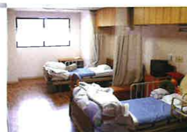
機能的でありながら、お二人のプライバシーを最大限に考慮した心休まる二人部屋