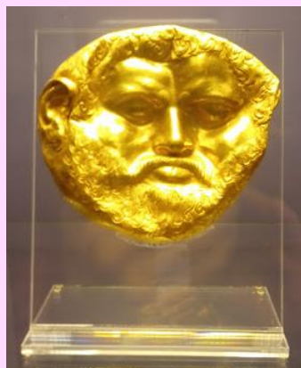
トラキア王の 黄金マスク