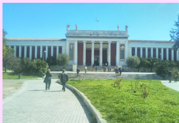
アテネ国立考古学博物館

ムステイエ文化、オーリニャック文化、スタルチェヴォ文化、トラキア文化など、日本ではほとんど知られていないバルカンと中・東欧諸国の旧石器時代から鉄器時代までの魅力ある文化を、ユニークなヴィーナス像や黄金マスクなどの遺物やエピソードを交えながら、所蔵している博物館などを2回に分けてご案内致します。意外にも、日本の古代文化と通底する世界が広がっていることに気づかされます。