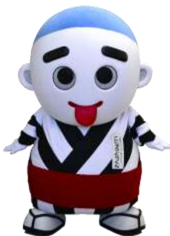
四日市市マスコットキャラクター 「こにゅうどうくん」