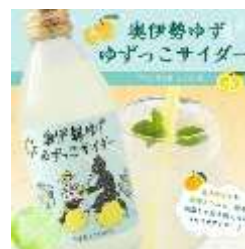
ゆずっこサイダー