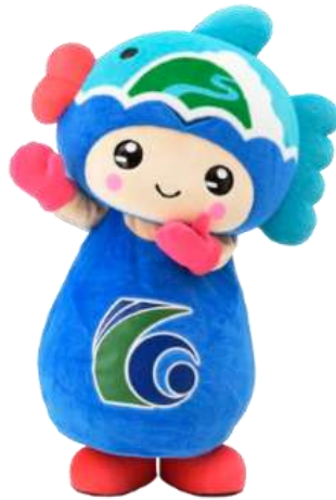
紀北町のマスコット キャラクター 「きーほくん」