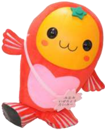
南伊勢町のマスコット キャラクター 「たいみ〜」