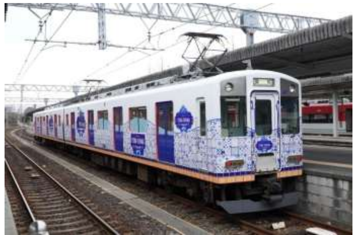
とばしまメモリー なみの章

(※)「伊勢志摩漁行商組合連合会」の鮮魚運搬専用貸し切り車両として、平日朝に松阪駅から大阪上本町駅まで運行しています。