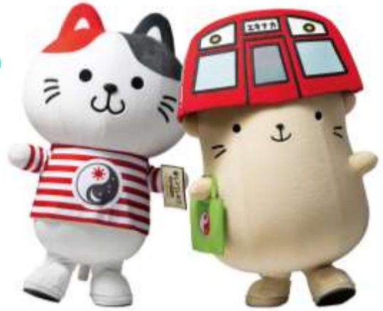
タイムズプレイス 公式マスケットキャラクター 「えきにゃか」・「たいむちゅ」

※最新の開催情報は、三重県関西事務所公式 X (旧 Twitter) をご確認ください。