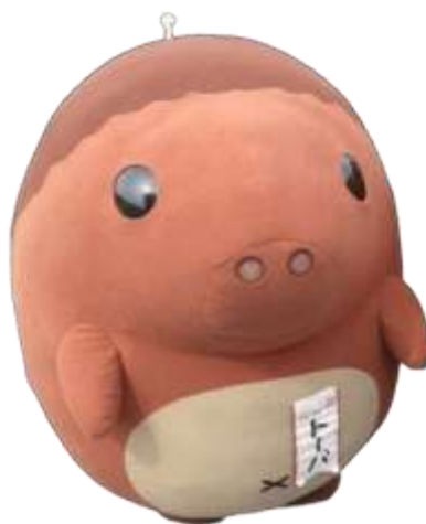
鳥羽市のご当地バーガー 「とばーがー」のキャラクター 「トーバ」 ©はっとりみつる