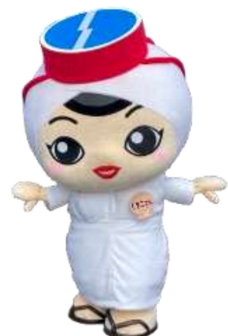
志摩市のPRキャラクター 「しまこさん」