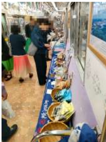
過去の開催の様子