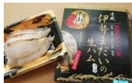
凍眠冷凍伊勢まだいの生ハム