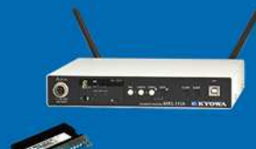
デジタルテレメーター MRS-100シリーズ