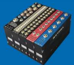
衝突試験計測システム DIS-7000シリーズ