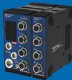
コンパクトレコーダー CTRSシリーズ