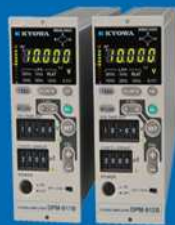
動ひずみ測定器 DPM-900シリーズ